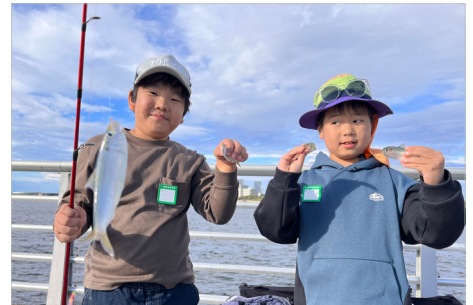
*写真は過去の参加者の様子ですので、イメージとしてご参照ください